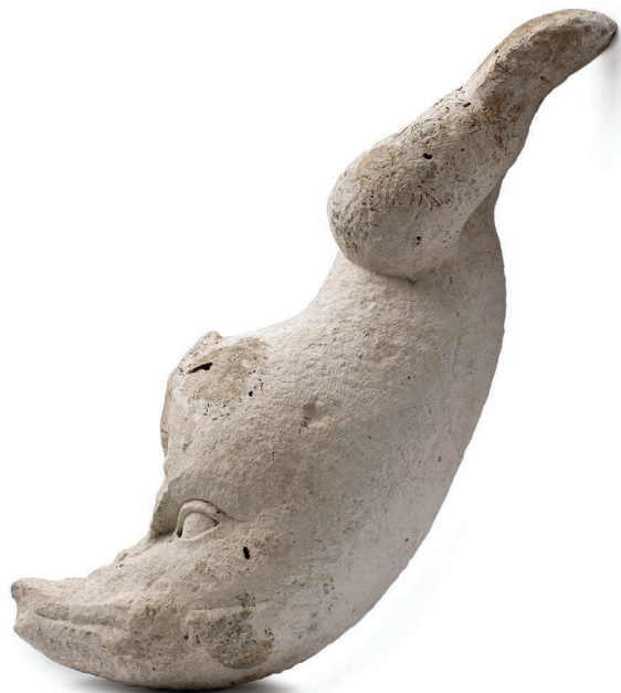
Skulptura dupina, Pula, kamen, kraj 2. do 5. st. Delfino, scultura, Pola, pietra, fine II sec.-V sec. Sculpture of a dolphin, Pula, stone, late 2 nd to 5 th c.

PON UTO SRI ČET PET SUB NED LUN MAR MER GIO VEN SAB DOM MON TUE WED THU FRI SAT SUN