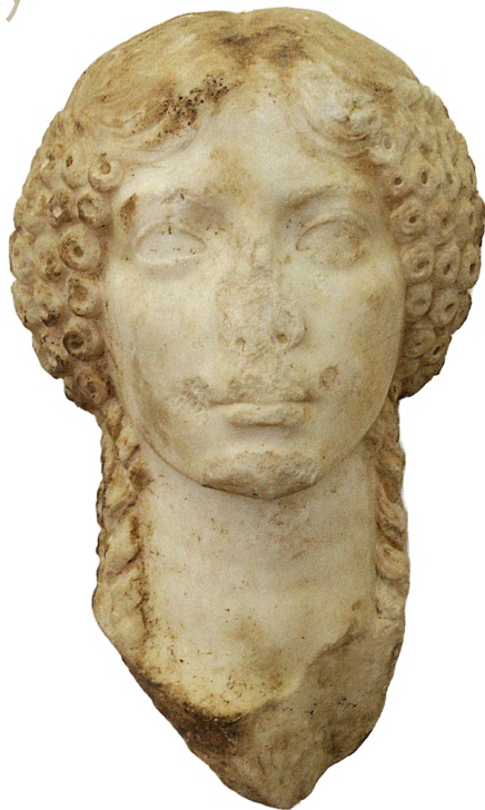
Agrippina Mlađa, Pula, mramor, sredina 1. st. Agrippina Minore, Pola, marmo, metà I sec. Agrippina the Younger, Pula, marble, mid-1 st c.

PON UTO SRI ČET PET SUB NED LUN MAR MER GIO VEN SAB DOM MON TUE WED THU FRI SAT SUN