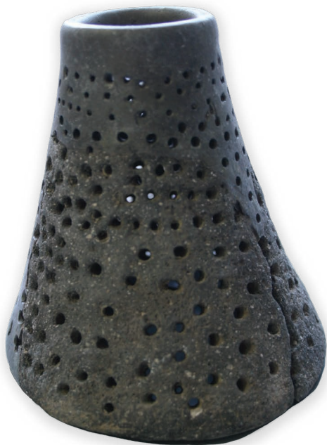
Cjedilo, uvala Zambratija, keramika, 4. tisućljeće pr. Kr. Colatoio, insenatura di Zambrattia, ceramica, IV millennio a. C. Colander, Zambratija cove, pottery, 4 th millennium BCE