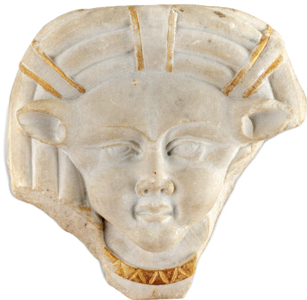
Hator, Pula, mramor, I. st. Hathor, Pola, marmo, I sec. Hathor, Pula, marble, 1 st c.